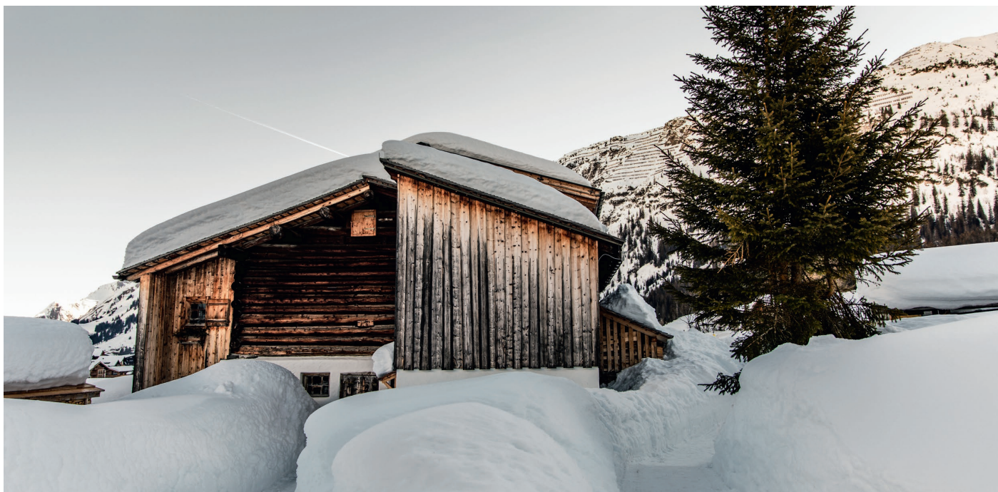
Winterurlaub in einer Hütte in Lech am Arlberg