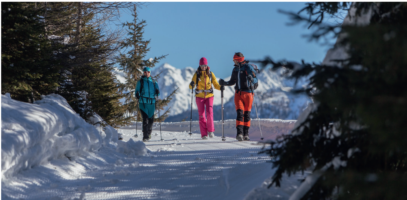
Winterwandern in Kartitsch