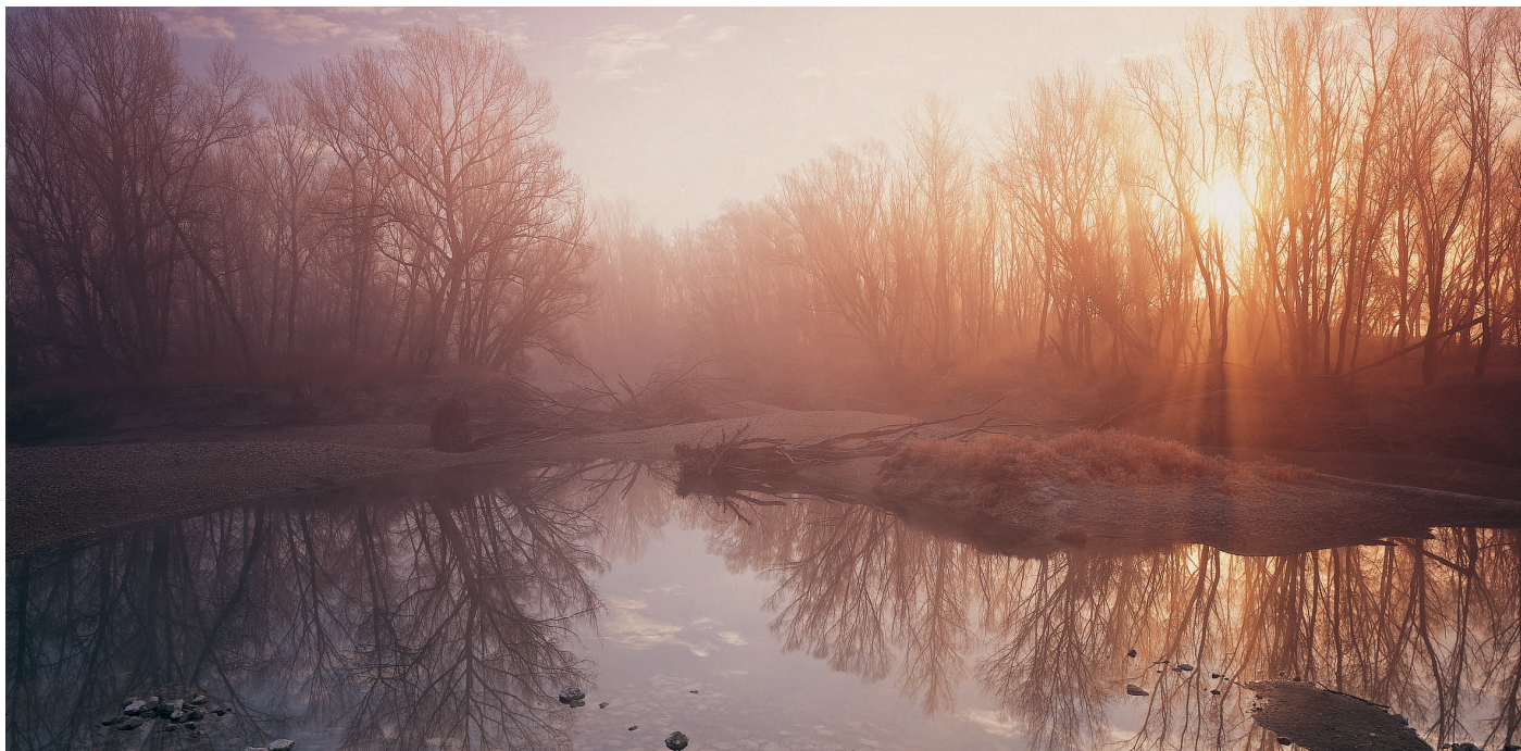
Winterstimmung im Nationalpark Donau-Auen