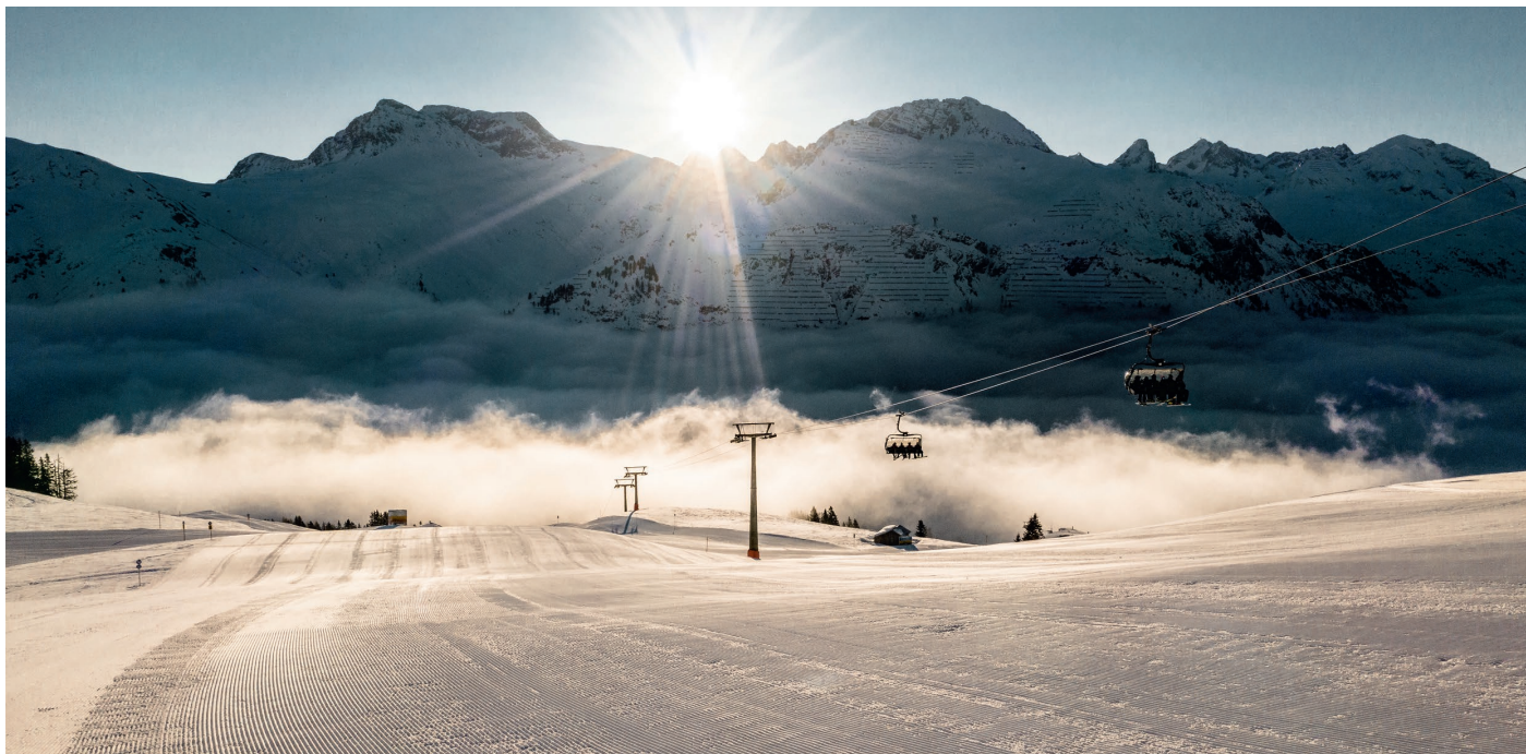
Skigebiet Lech am Arlberg