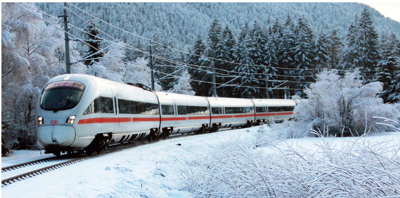
ICE in Winterlandschaft