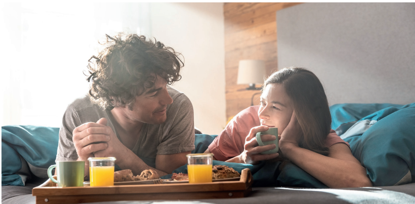
Frühstücken im Urlaub – Zeit für die Familie