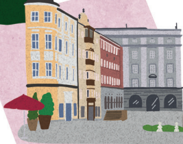
SCHLOSSMUSEUM UND ALTSTADT