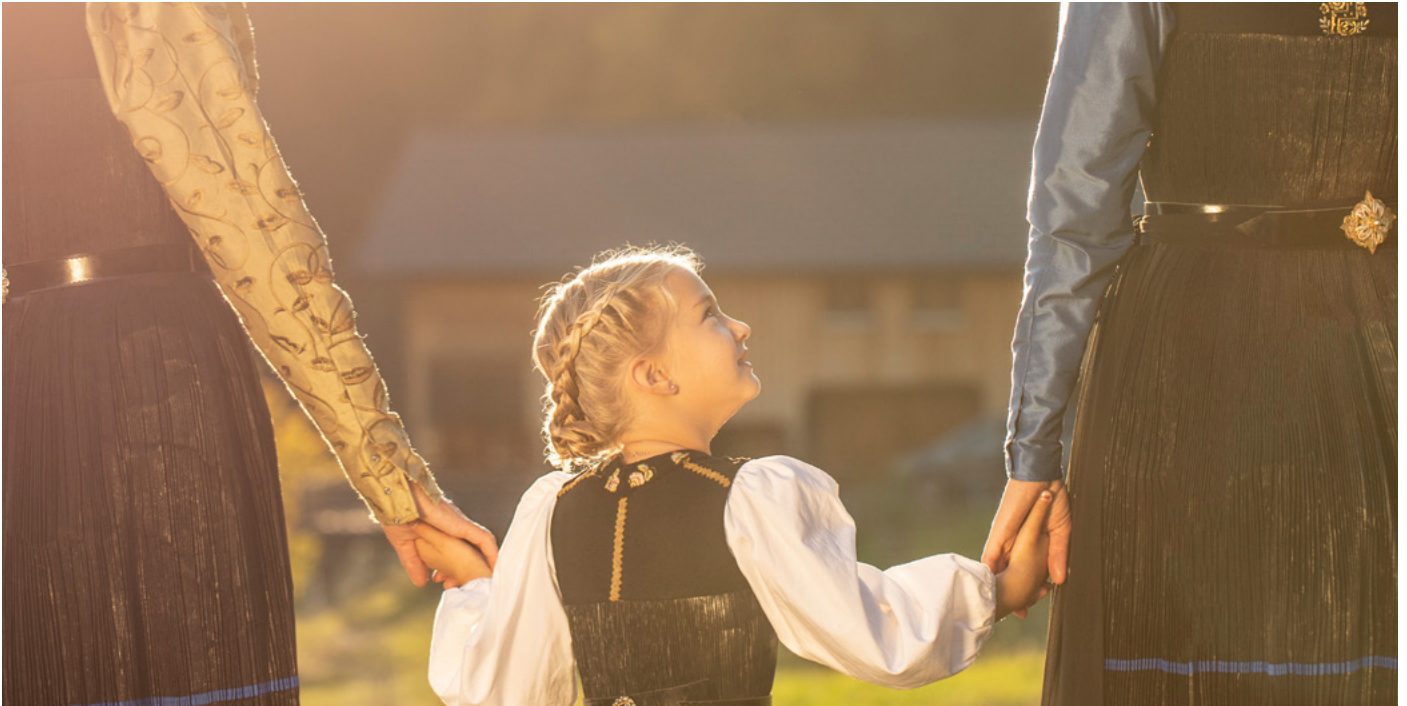
Mädchen in der Juppe Bregenzerwald Vorarlberg