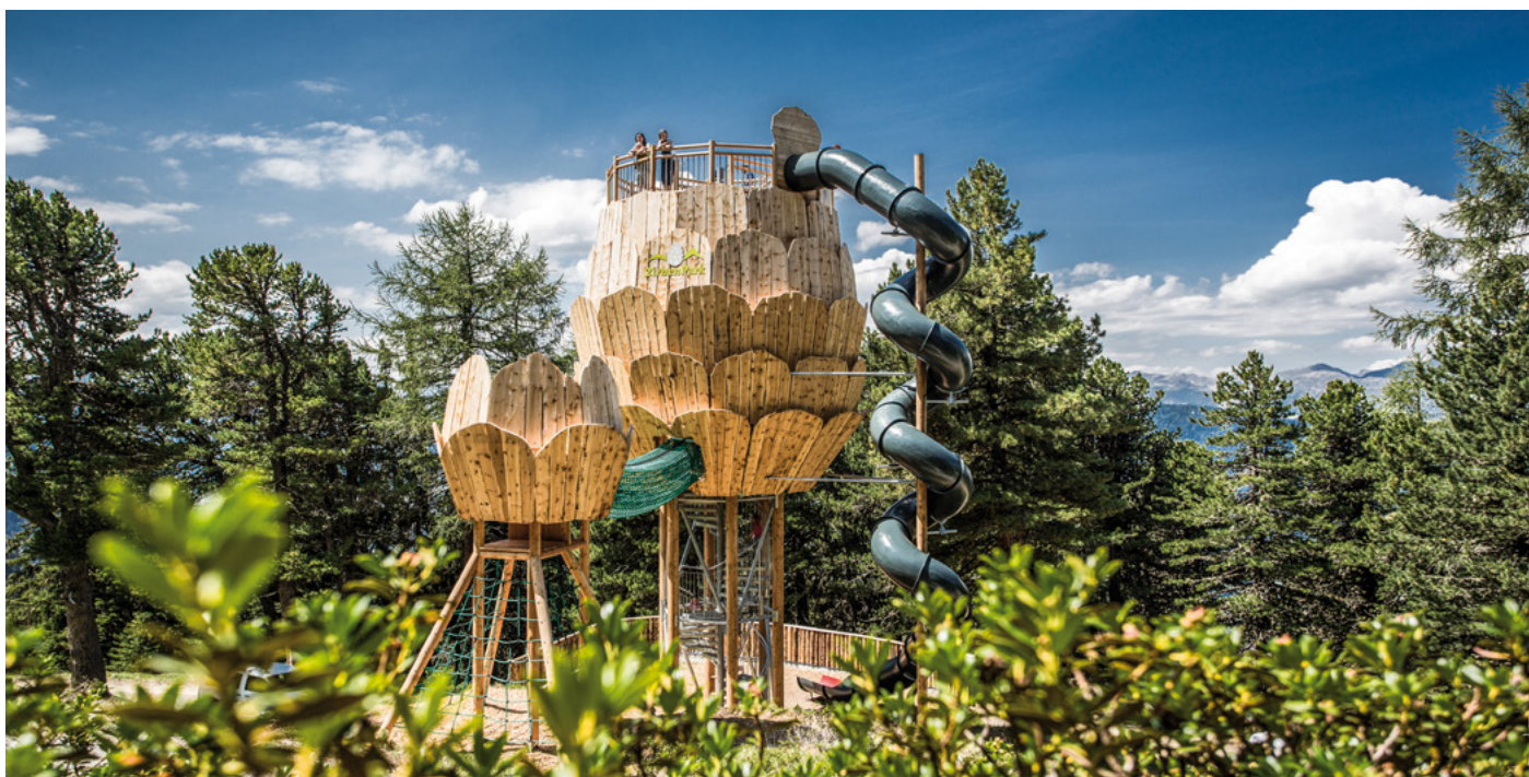
Zirbenpark am Hochzeiger im Pitztal