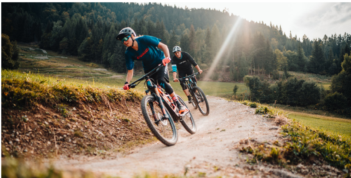
Mountainbiken Baumgartnerhöhe