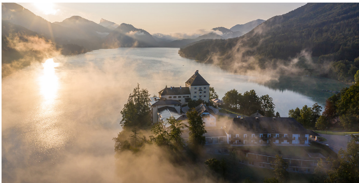
Drohnenansicht – Schloss Fuschl © Andreas Gall