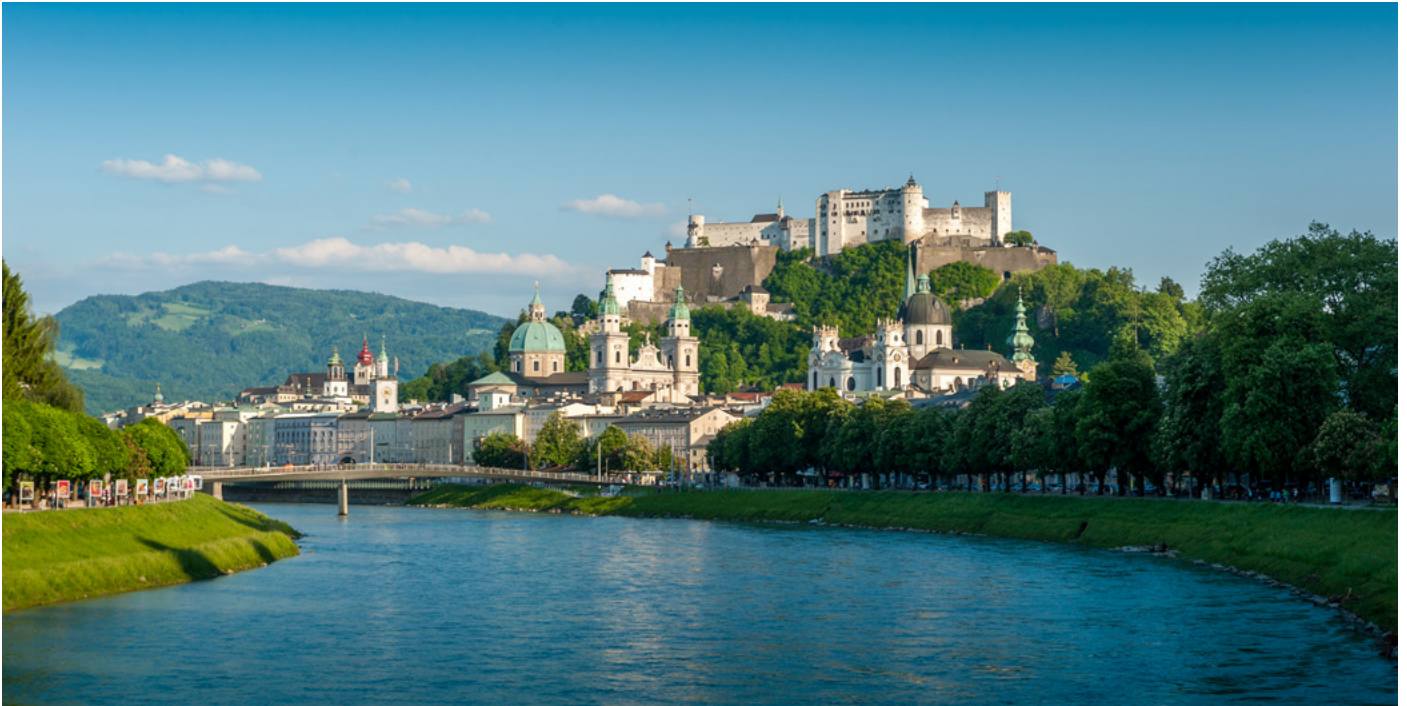
Stadtansicht Salzburg