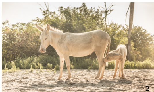
Koryto rzeki Dyi 1 Park Narodowy Jezioro Nezyderskie 2