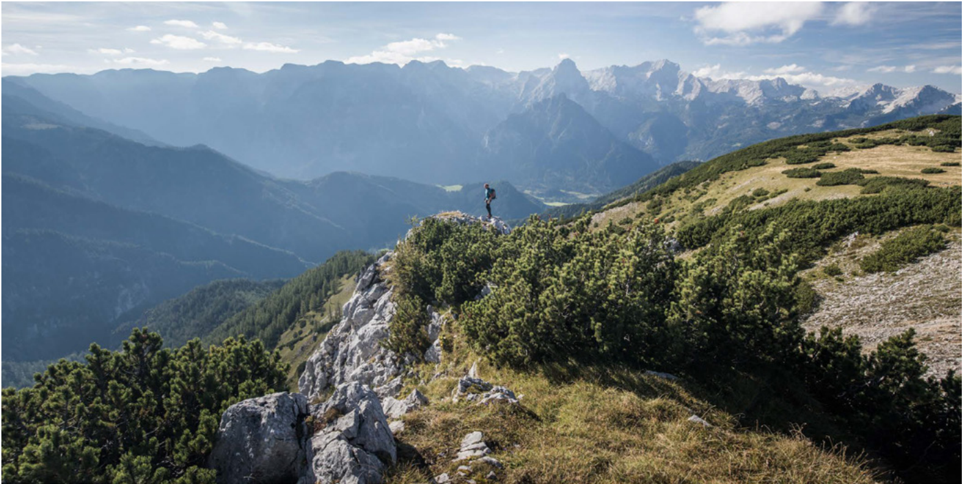
Bergwandern in der Urlaubsregion Pyhrn-Priel in Oberösterreich