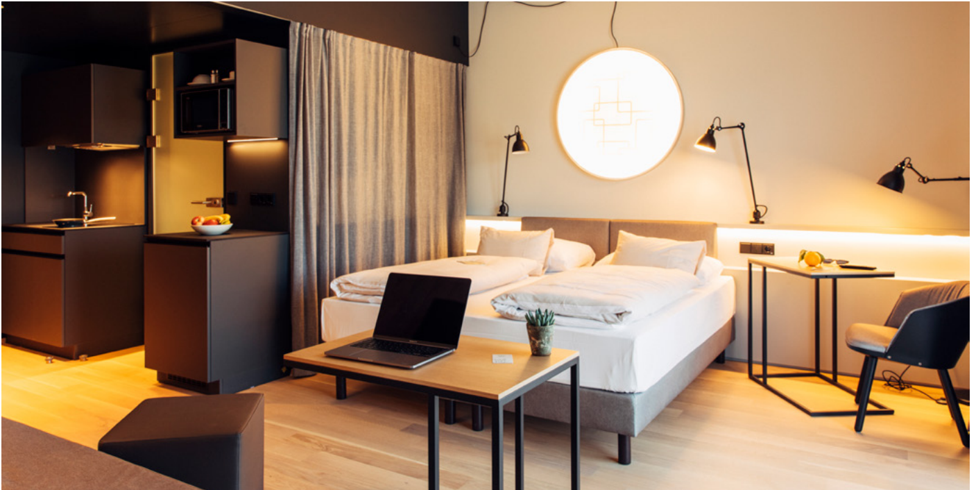
harry's home Studio Business