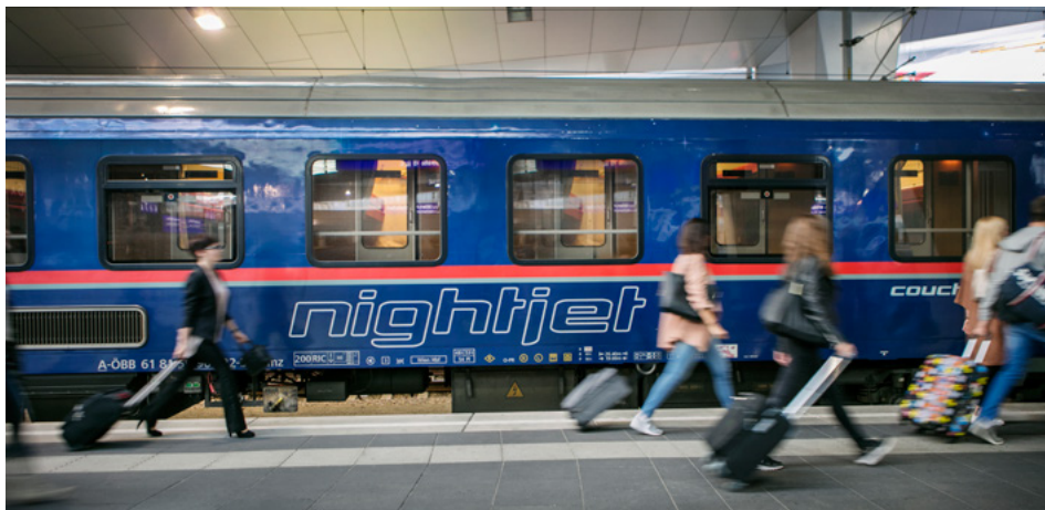
Außenansicht Nightjet